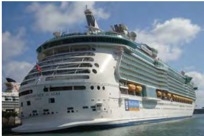
Cruise-fartøyet "Independence of the Seas" til kai i Las Palmas.