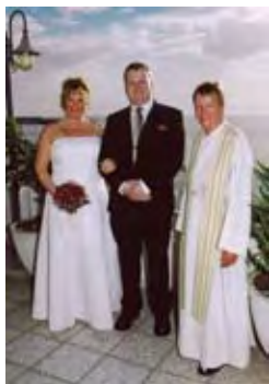
Brudgom på Sjømannskirken i 2005, nå kaptein på "Dr. Fridtjof Nansen"