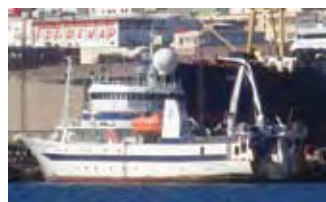
Skipssiden s. 14