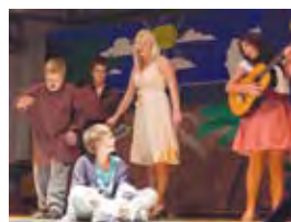
Ungdommer med flott forestilling s.19