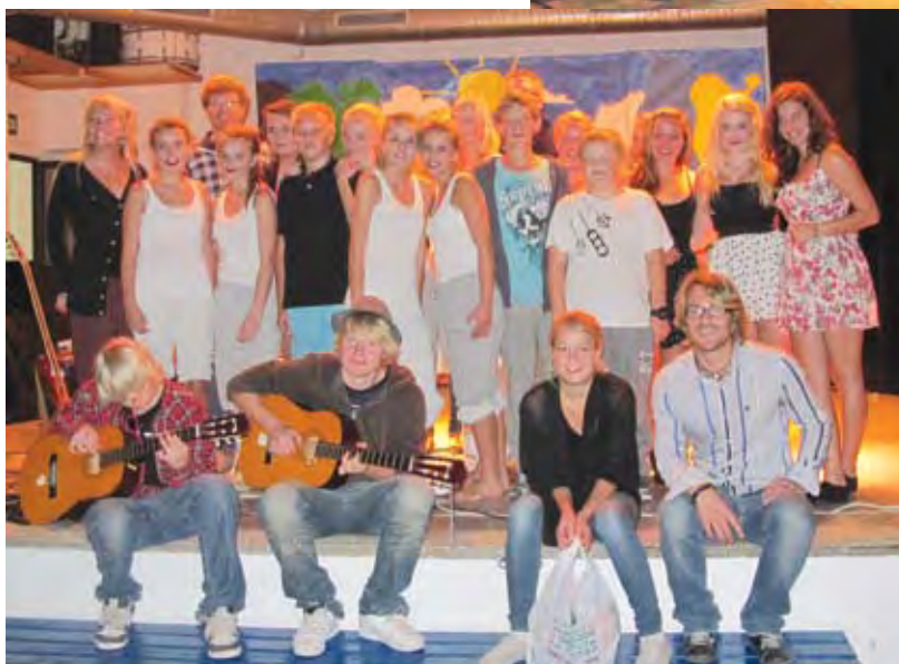
Et fornøyd ensemble puster ut etter en vellykket forestilling.