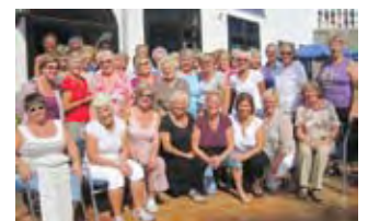
Basargruppa 20 år s. 16