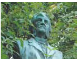
Grunnleggeren s. 11