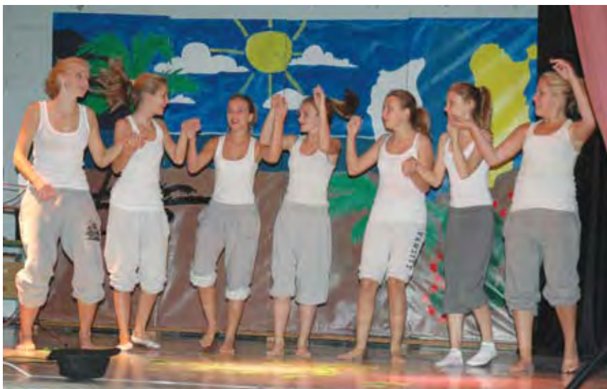
Bilde over: Danserne takker for velfortjent applaus.