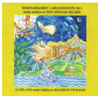
CD-cover laget av Tara Djume. Det er fremdeles noen få CD-er igjen for salg.

Konsertene med Altiplano og Per Oddvar Hildres seminarkor ved slutten av fjoråret ga et samlet overskudd på over 5000 €.