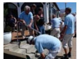
Dugnad s. 12