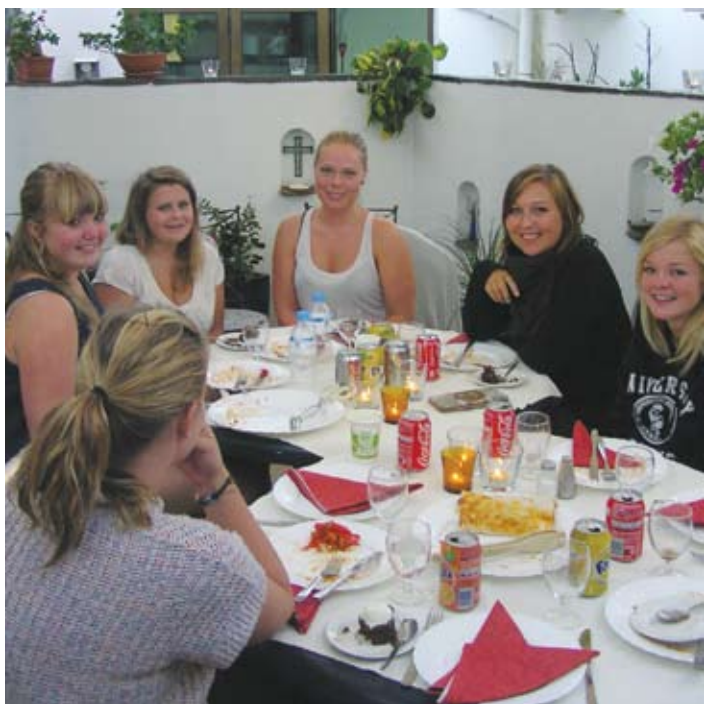
Studentmiddag i kirkens bakhage