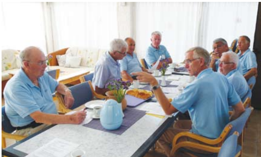
Her er det dugnadsgruppa som drøfter aktuelle oppgaver over en kopp kaffe.