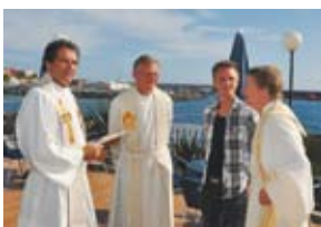
Innsettelse daglig leder s. 14