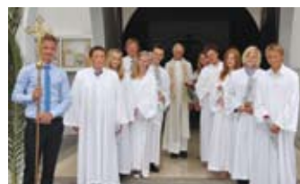
Konfirmasjon s. 9