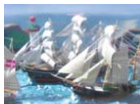
Flaskeskip s. 8