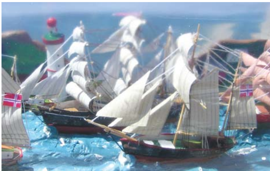
Utsnitt av flaskeflåten, barken "Kerdalia" er skipet bakerst, nærmest fyret.