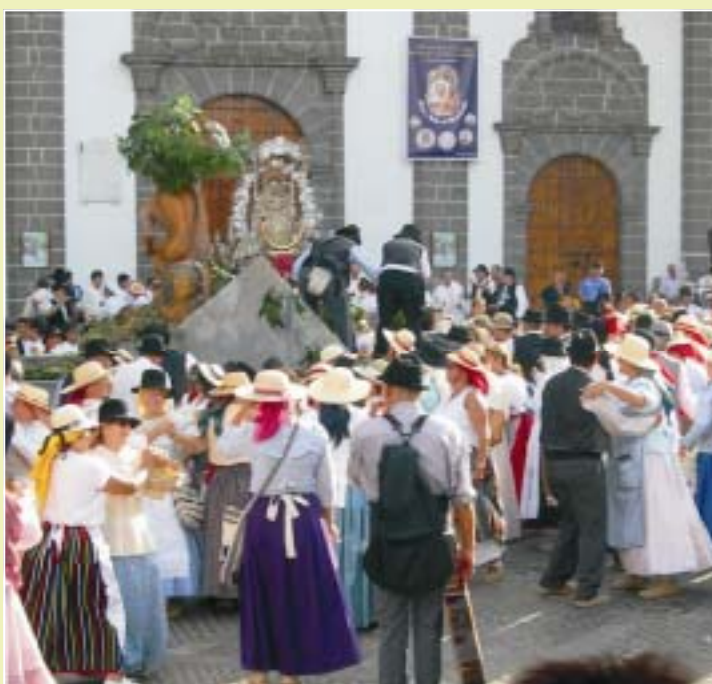
Deltakarar i alle aldrar.