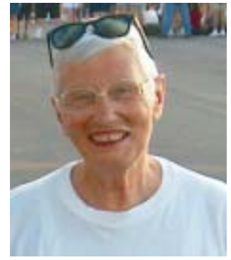
Pensjonistparet har vært i solen før... Disse bildene er fra San Francisco.