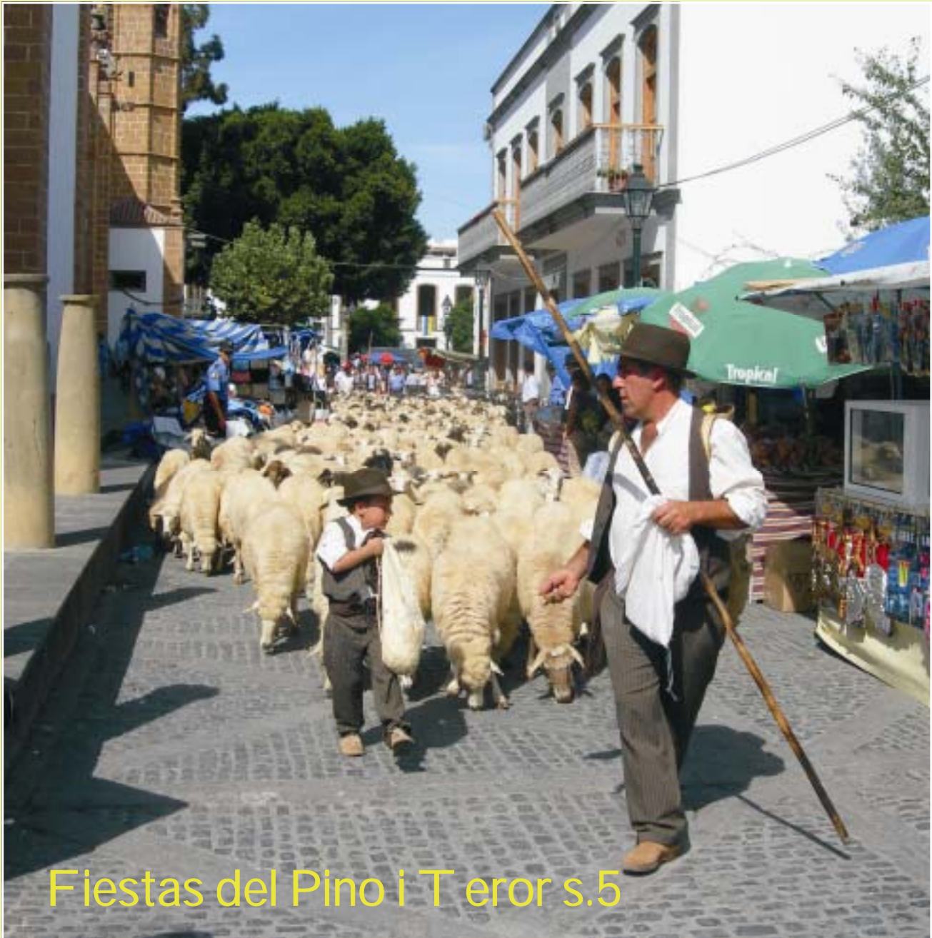
Fiestas del Pino i Teror s.5

Måken - et informasjonsblad fra Sjømannskirken på Gran Canaria Nr.3 - 2006