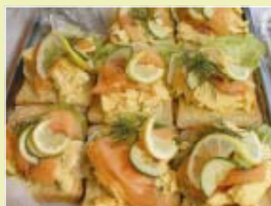
BASAR Side 10