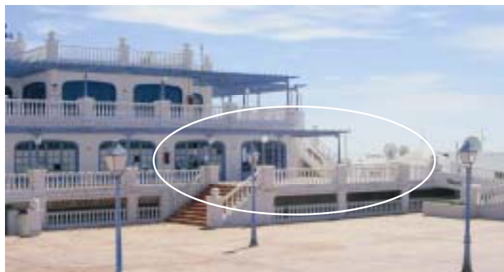
Lokalet ligger i et senter med store uteområder.