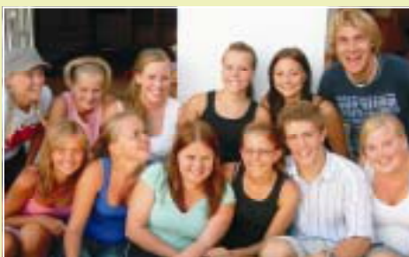
UNGDOMSARBEID Side 7