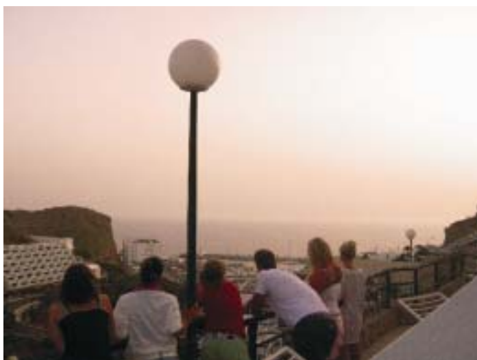
Solnedgang. Ett av Erlends mange blinkskudd.

Det er kjent at klimaet på Gran Canaria er gunstig året rundt. Derfor tror vi denne institusjonen fortsatt vil være til nytte for dem som har disse sykdommene.