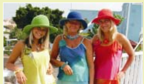
PIKENE PÅ BROEN side 23